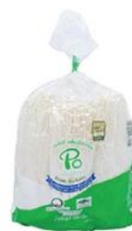
ขนาด 1000 กรัม